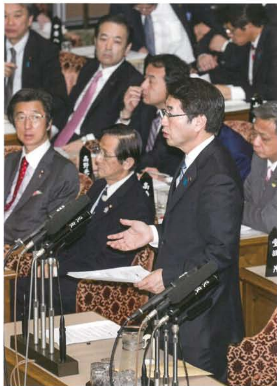
平成27年3月20日 参議院予算委員会で質疑に立つ。

昨年は米価が大幅下落し、農家は不安を抱えながらTPP交渉の行方を見守っています。アメリカ産主食用米の特別輸入枠が実現すれば、国産米へのダメージ