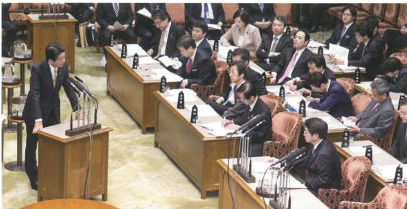
安倍総理が拉致被害者の一日も早い解決に向けた力強い決意を示す。